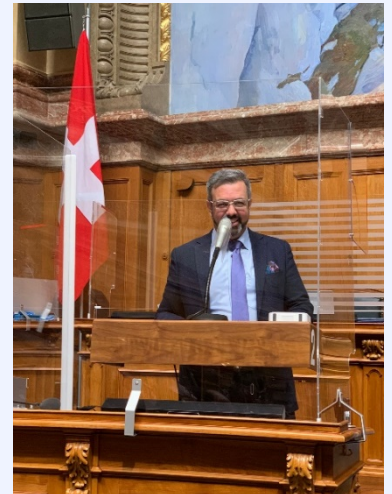
Votum zur Massentierhaltungsinitiative

Wir von der EVP hätten stattdessen einen indirekten Gegenvorschlag zur Volksinitiative sehr begrüßt. Dieser wäre bei Ablehnung der Initiative vor dem Volk automatisch in Kraft getreten. Ein entsprechender Antrag im Nationalrat wurde von uns mitgetragen, scheiterte jedoch ebenfalls an den klaren Mehrheitsverhältnissen. Ohne dieses zusätzliche Kompromissangebot droht nun erneut ein gehässiger Abstimmungskampf wie bei den beiden Agrarinitiativen im Frühling 2021, der die Gräben in der Landwirtschaft und gegenüber der Gesellschaft wieder aufreissen könnte.