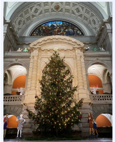
Jährlich begrüsst uns ein wunderschöner Weihnachtsbaum in der Kuppelhalle im Bundeshaus. Dieses Jahr war er umgeben von den vielen Frauen, die seit der Frauensession im Bundeshaus aufgestellt sind.