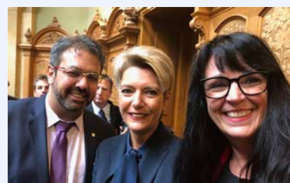
Wir gratulieren Karin Keller-Sutter!