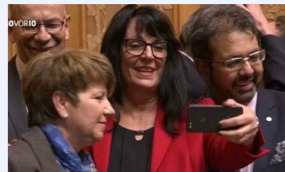
Wir gratulieren Viola Amherd!

Wir bedauern den Abschied dieser Vorzeigemagistratin sehr und wünschen ihr für die Zukunft von Herzen Gesundheit, Zufriedenheit, Elan für Neues und über allem Gottes Schutz und Segen.