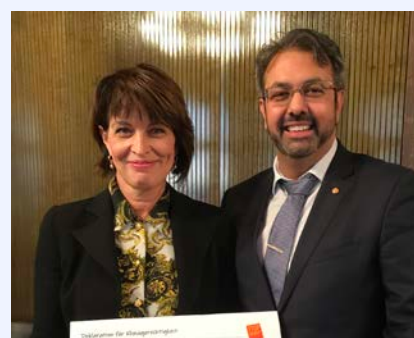
Doris Leuthard bedankt sich für die Deklaration für mehr Klimagerechtigkeit, die Nik ihr im Namen der Stop-Armut-Konferenz 2018 von www.stoparmut.ch überreichte.